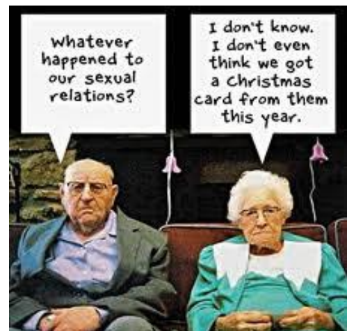
Figura 1: cartoline, gli anziani e la sessualità